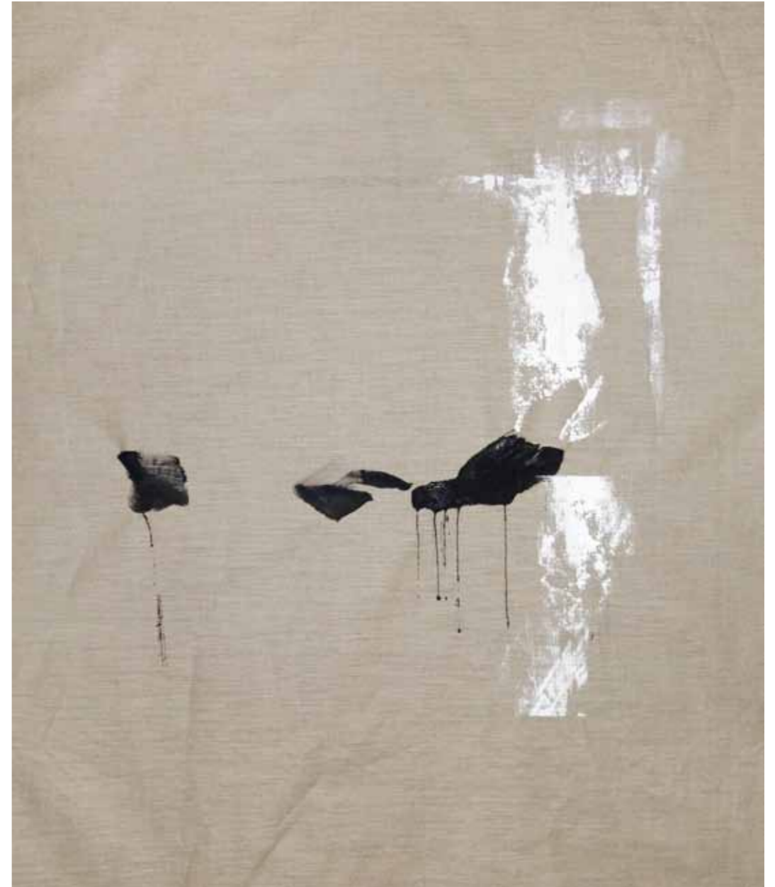
o. T., 2020, Acryl auf Leinwand, 145 × 125 cm