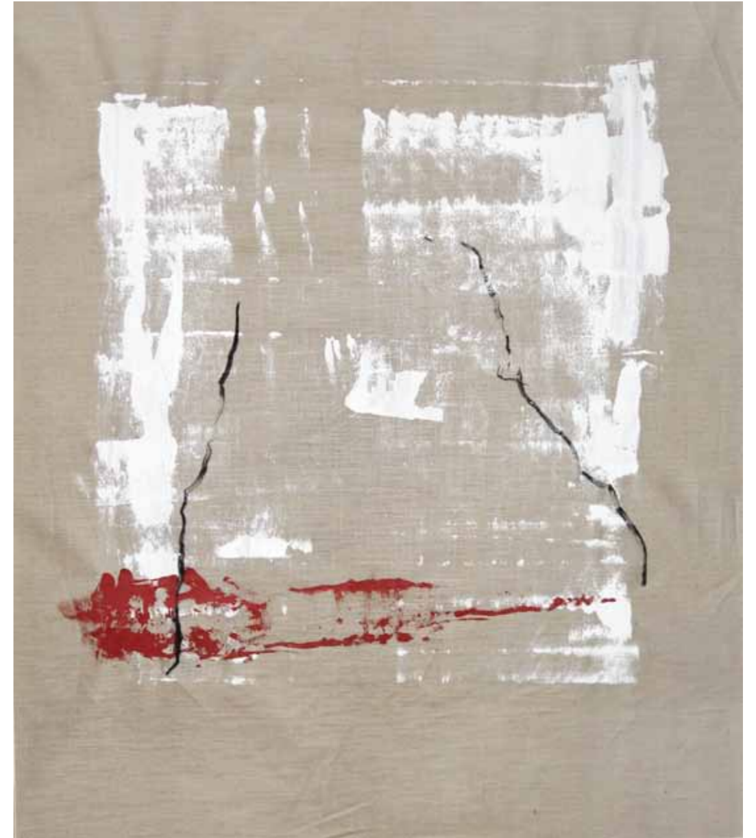
o. T., 2020, Acryl und Kohle auf Leinwand, 145 × 125 cm