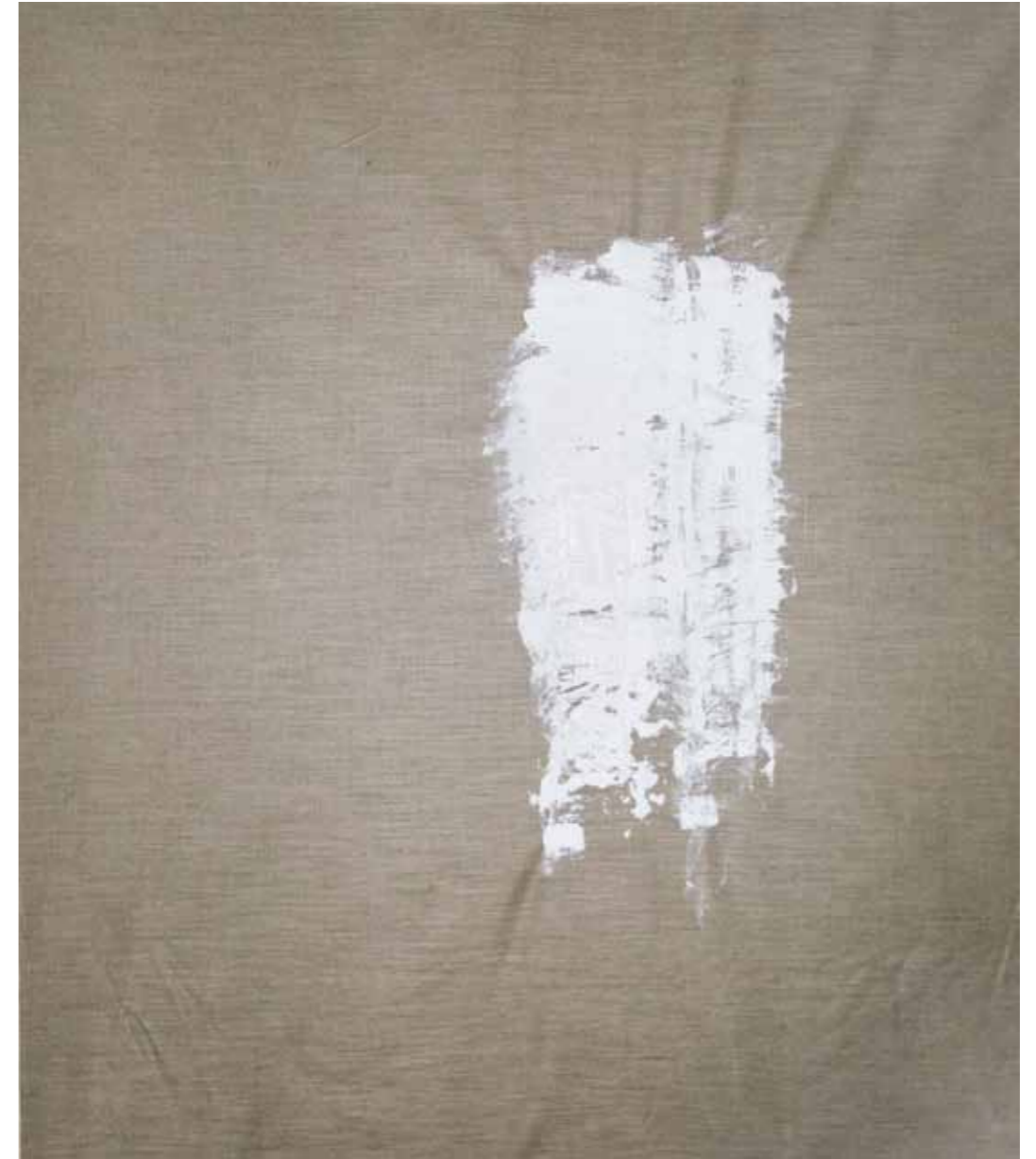
o. T., 2020, Acryl auf Leinwand, 145 × 125 cm