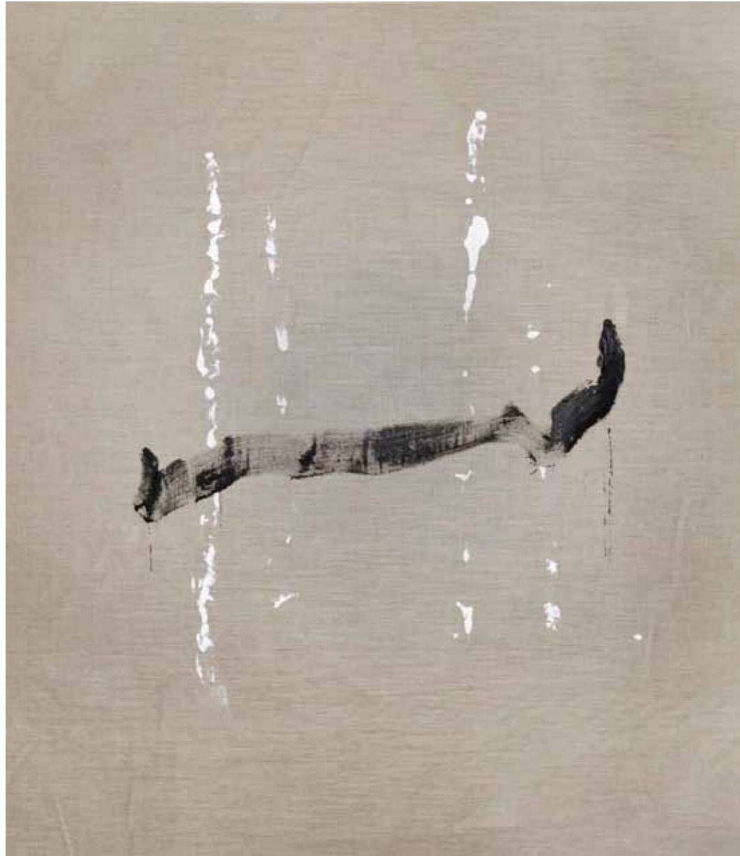
o. T., 2020, Acryl auf Leinwand, 145 × 125 cm