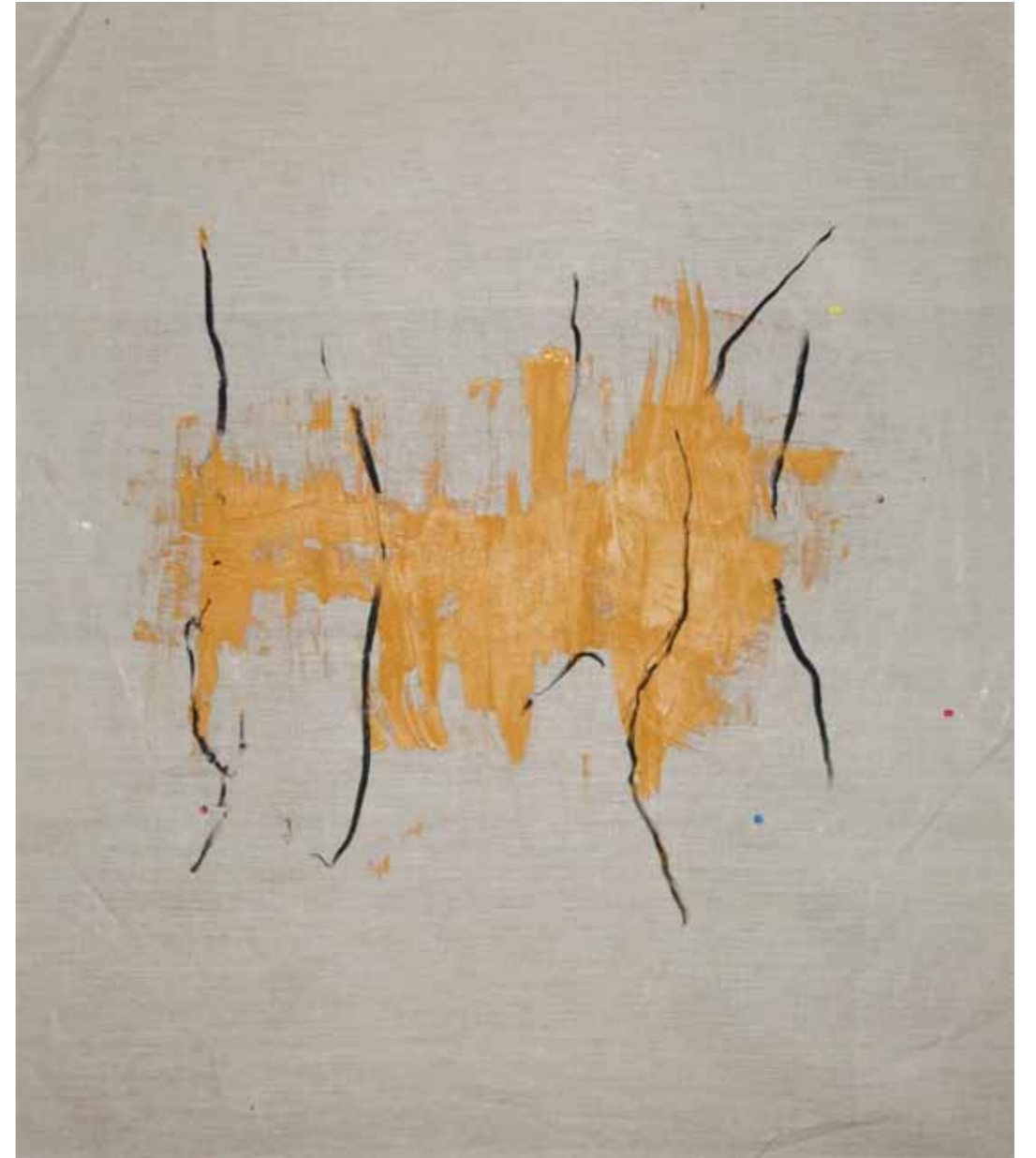
o. T., 2020, Acryl und Kohle auf Leinwand, 145 × 125 cm