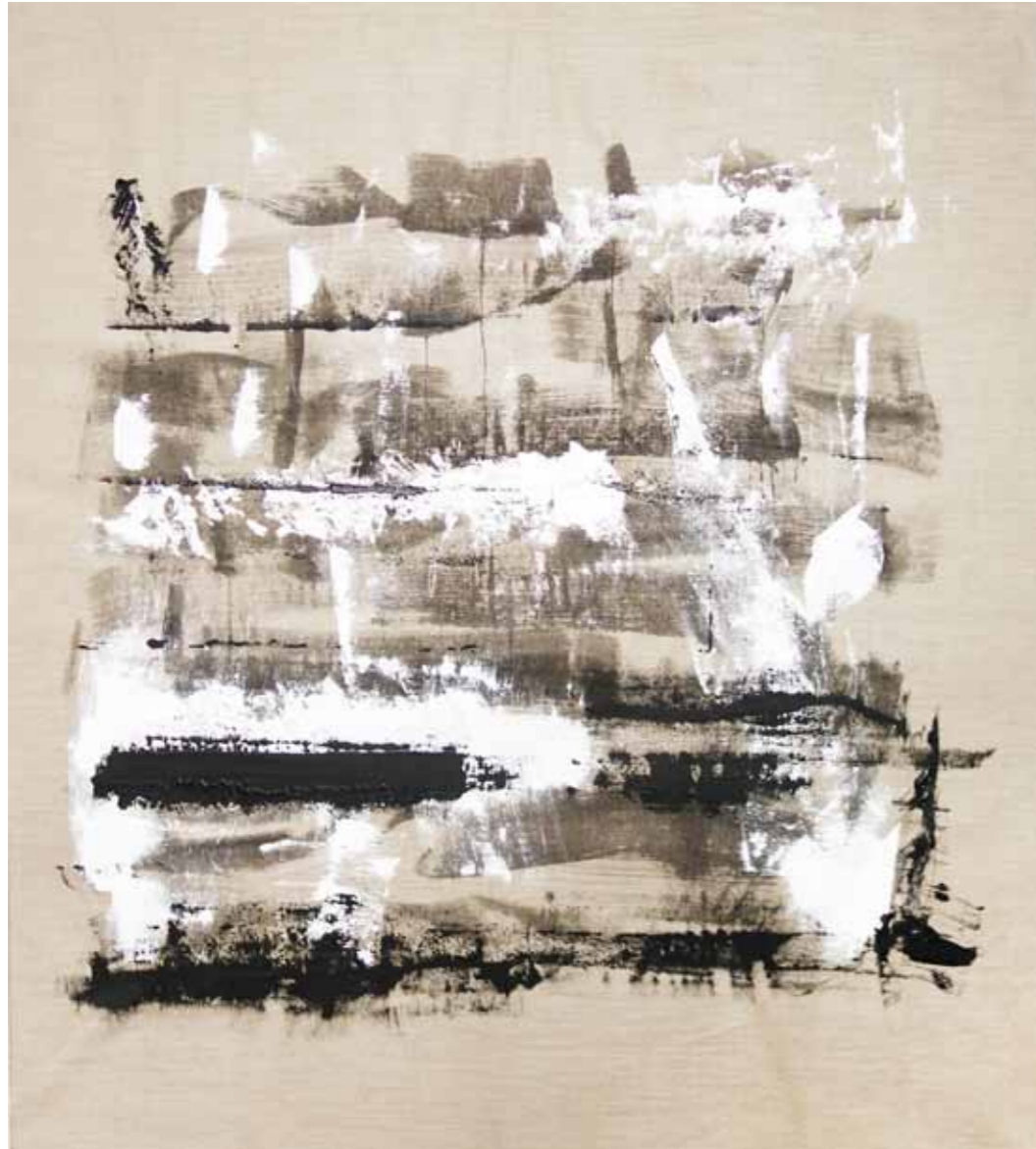
o. T., 2020, Acryl auf Leinwand, 145 × 125 cm