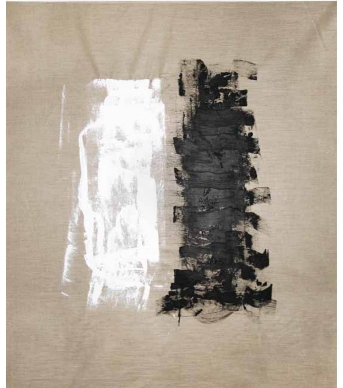
o. T., 2020, Acryl auf Leinwand, 145 × 125 cm