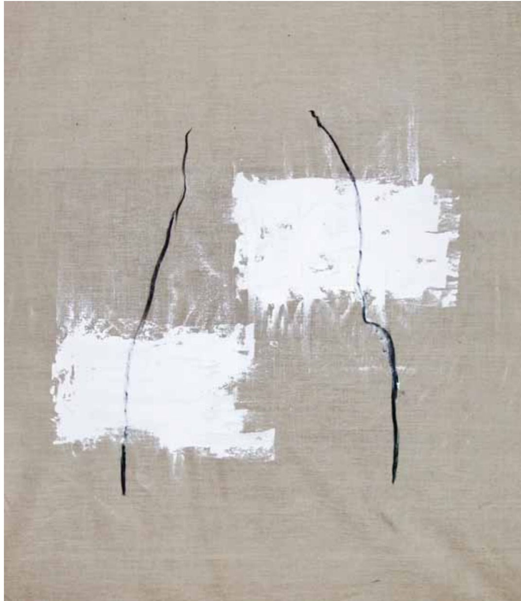
o. T., 2020, Acryl und Kohle auf Leinwand, 145 × 125 cm