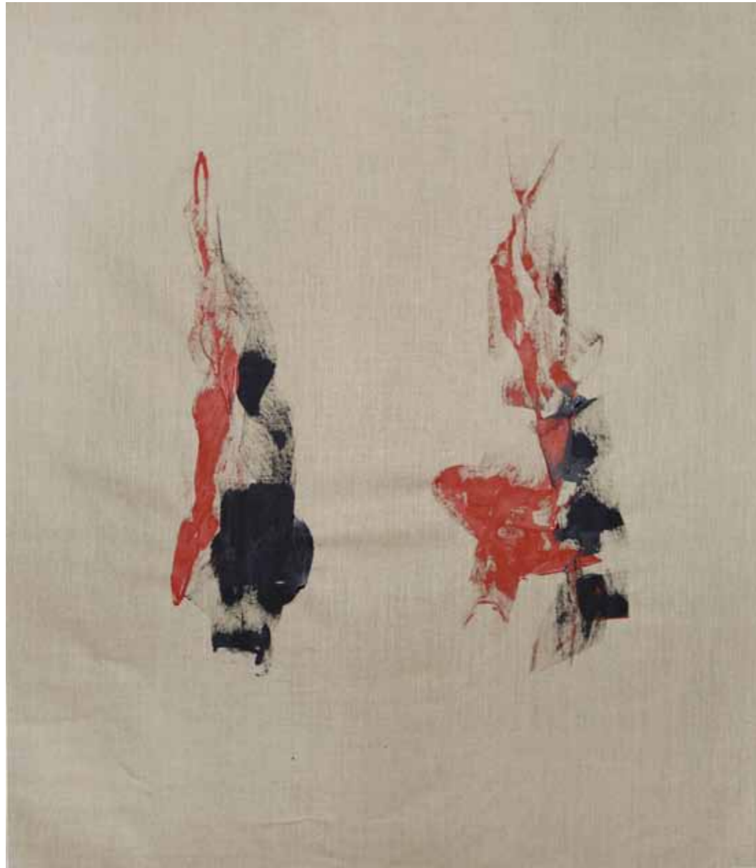
o. T., 2015, Acryl auf Leinwand, 145 × 125 cm