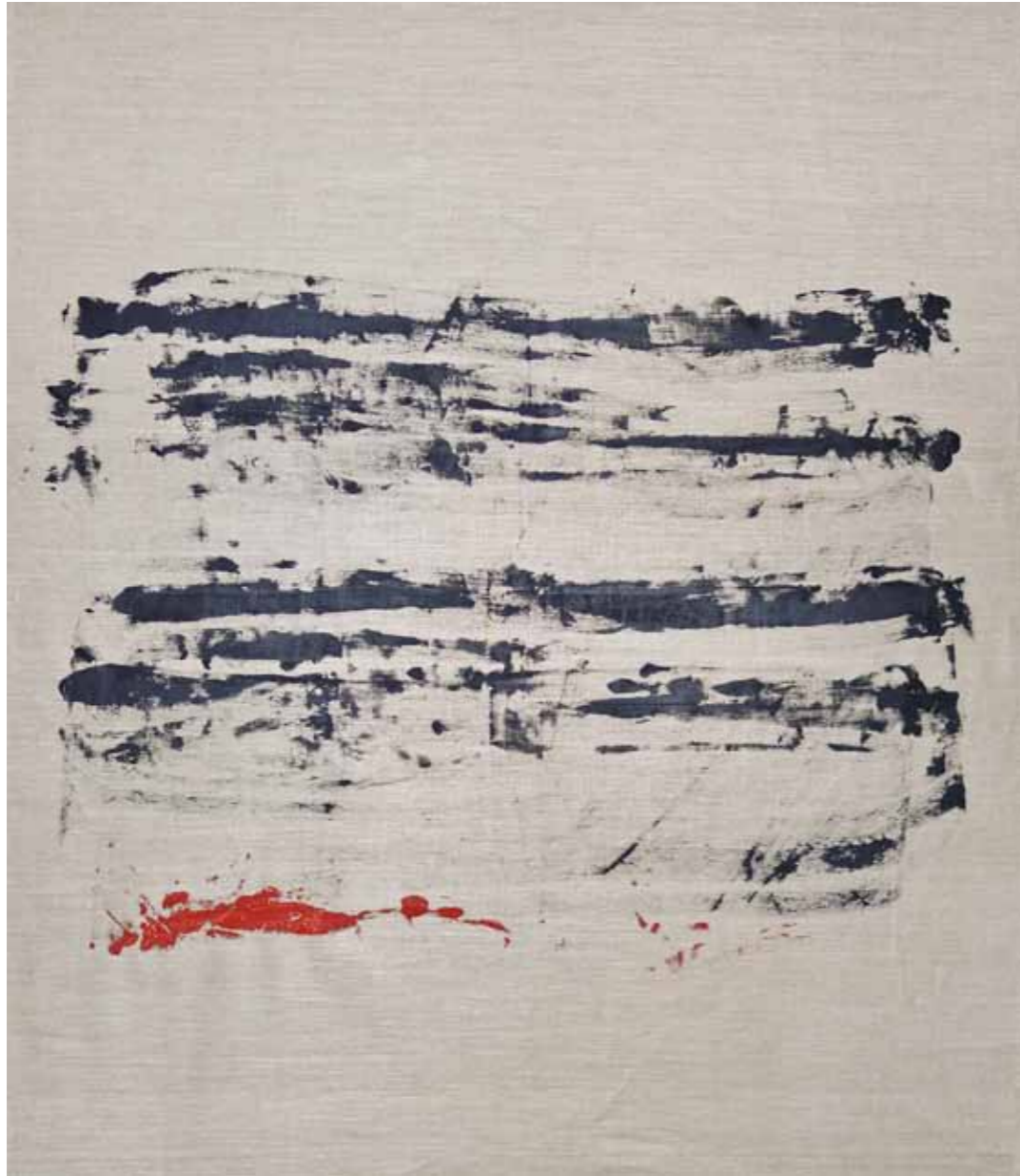
o. T., 2015, Acryl auf Leinwand, 145 × 125 cm