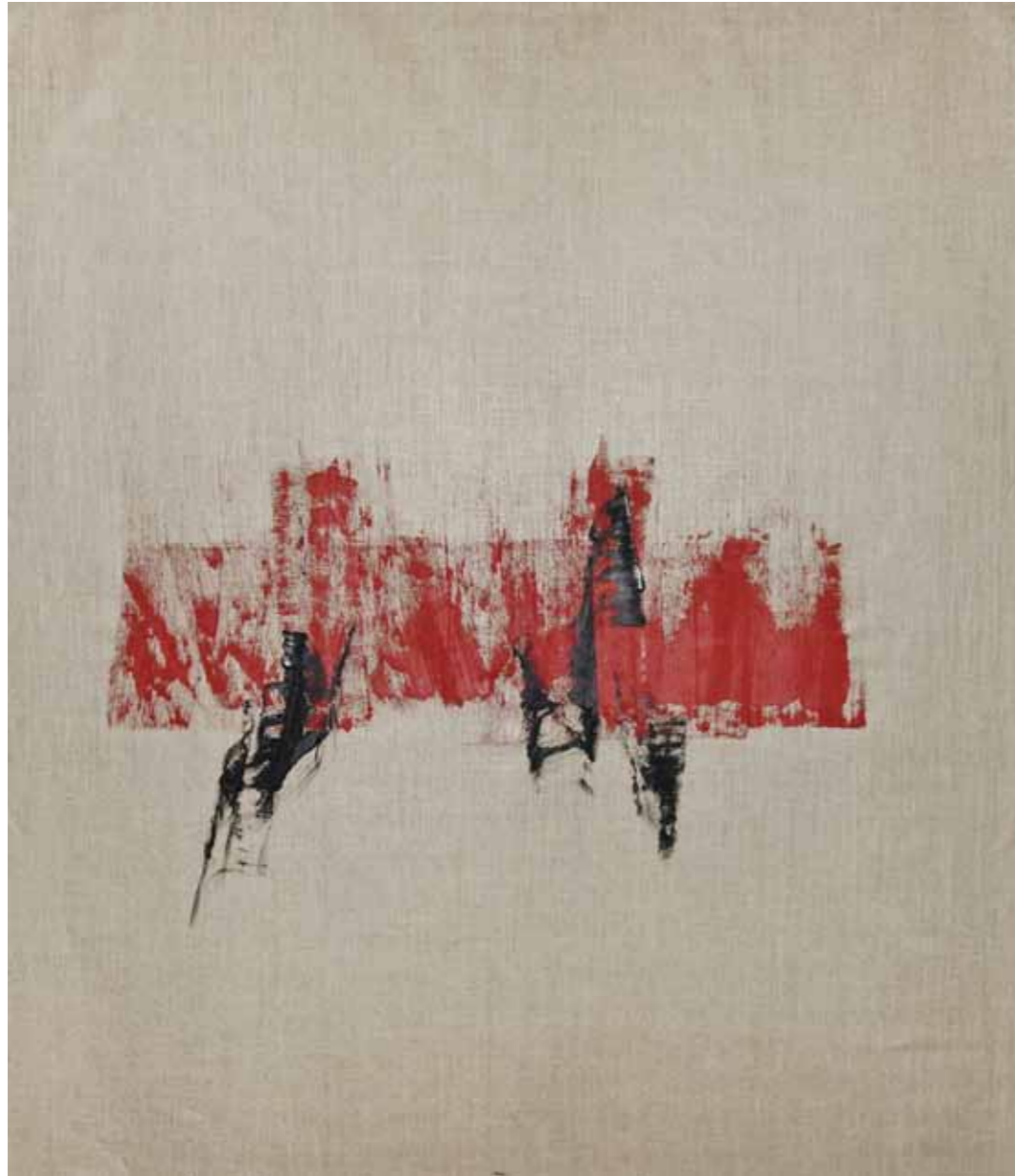
o. T., 2015, Acryl auf Leinwand, 145 × 125 cm