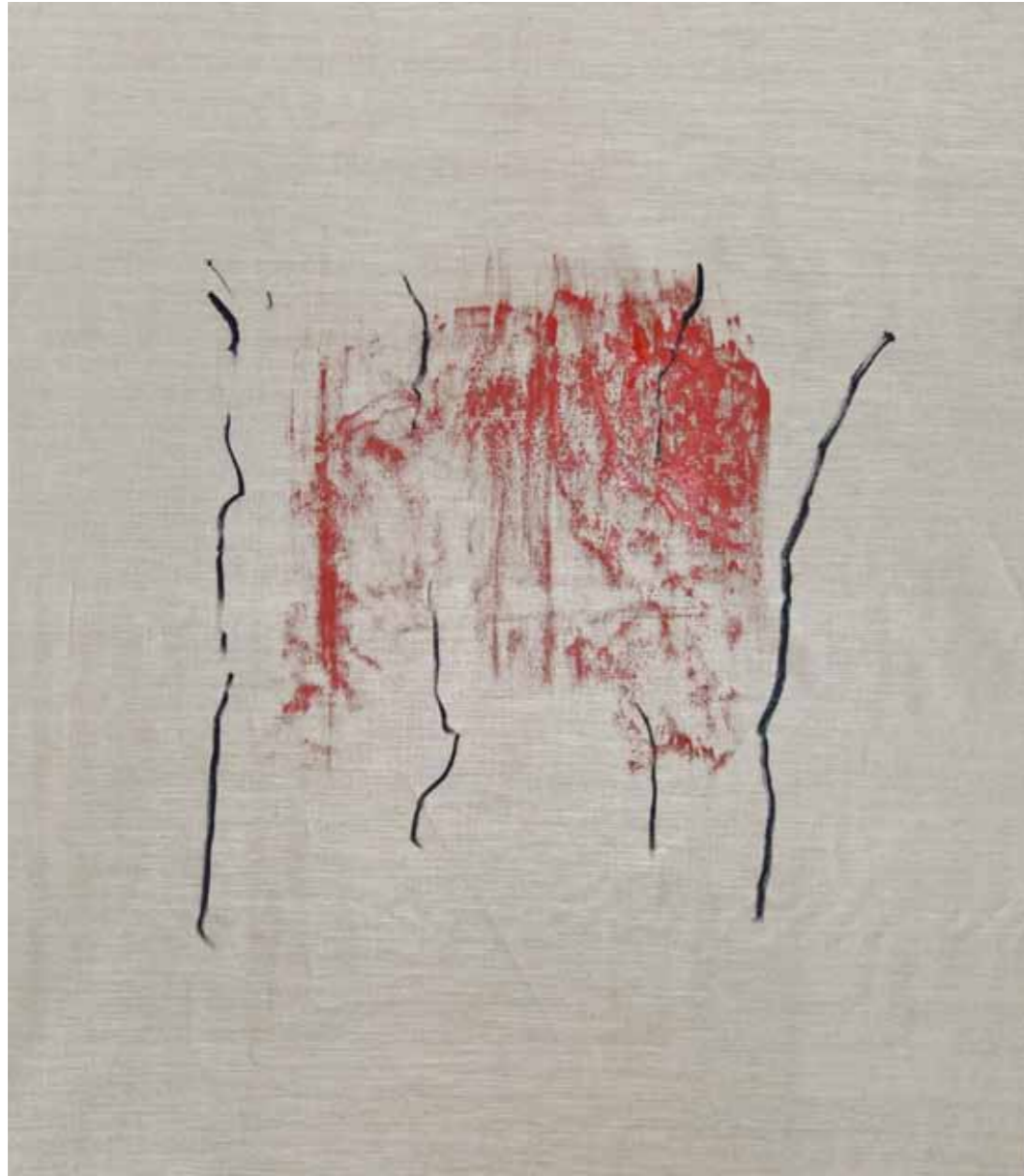
o. T., 2015, Acryl und Kohle auf Leinwand, 145 × 125 cm