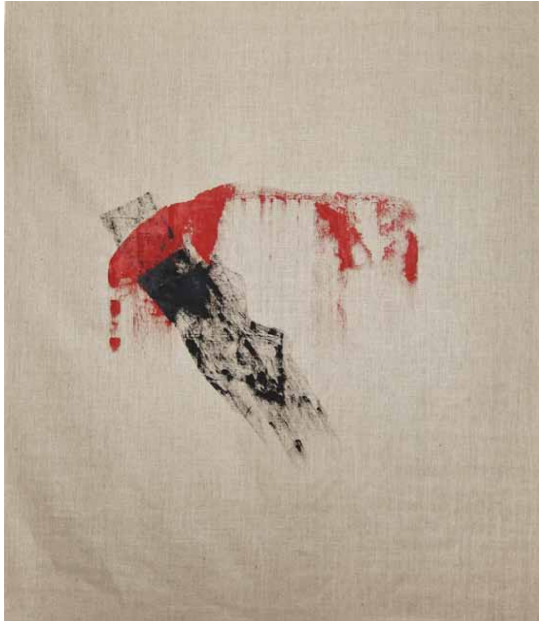
o. T., 2015, Acryl auf Leinwand, 145 × 125 cm