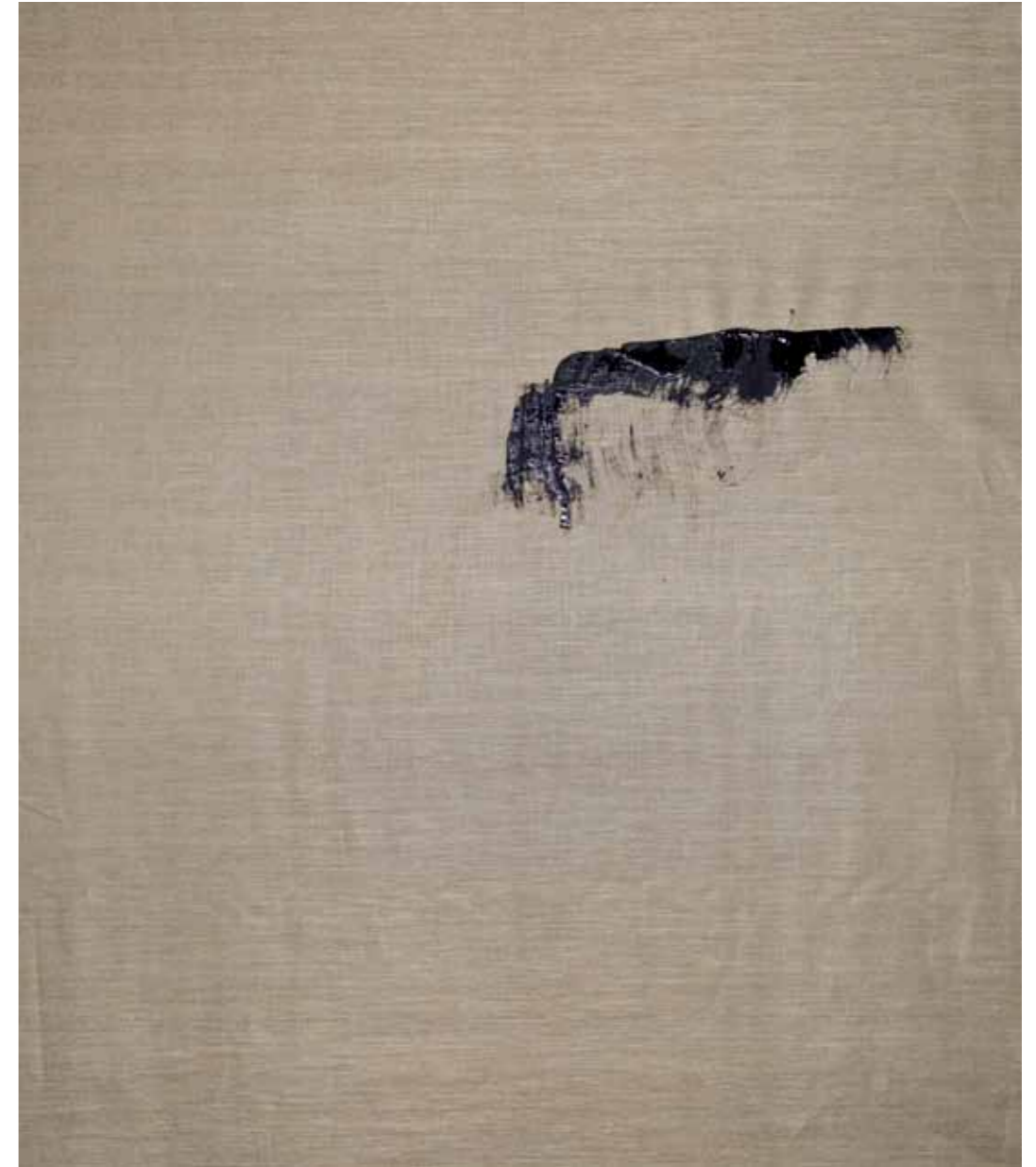
o. T., 2015, Acryl auf Leinwand, 145 × 125 cm