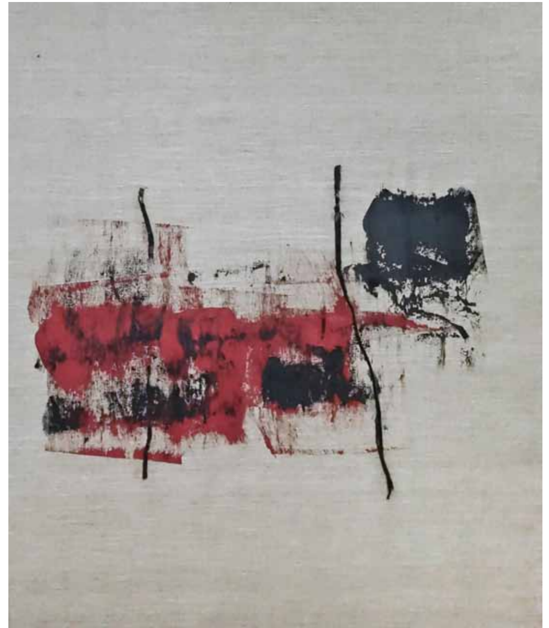
o. T., 2015, Acryl und Kohle auf Leinwand, 145 × 125 cm