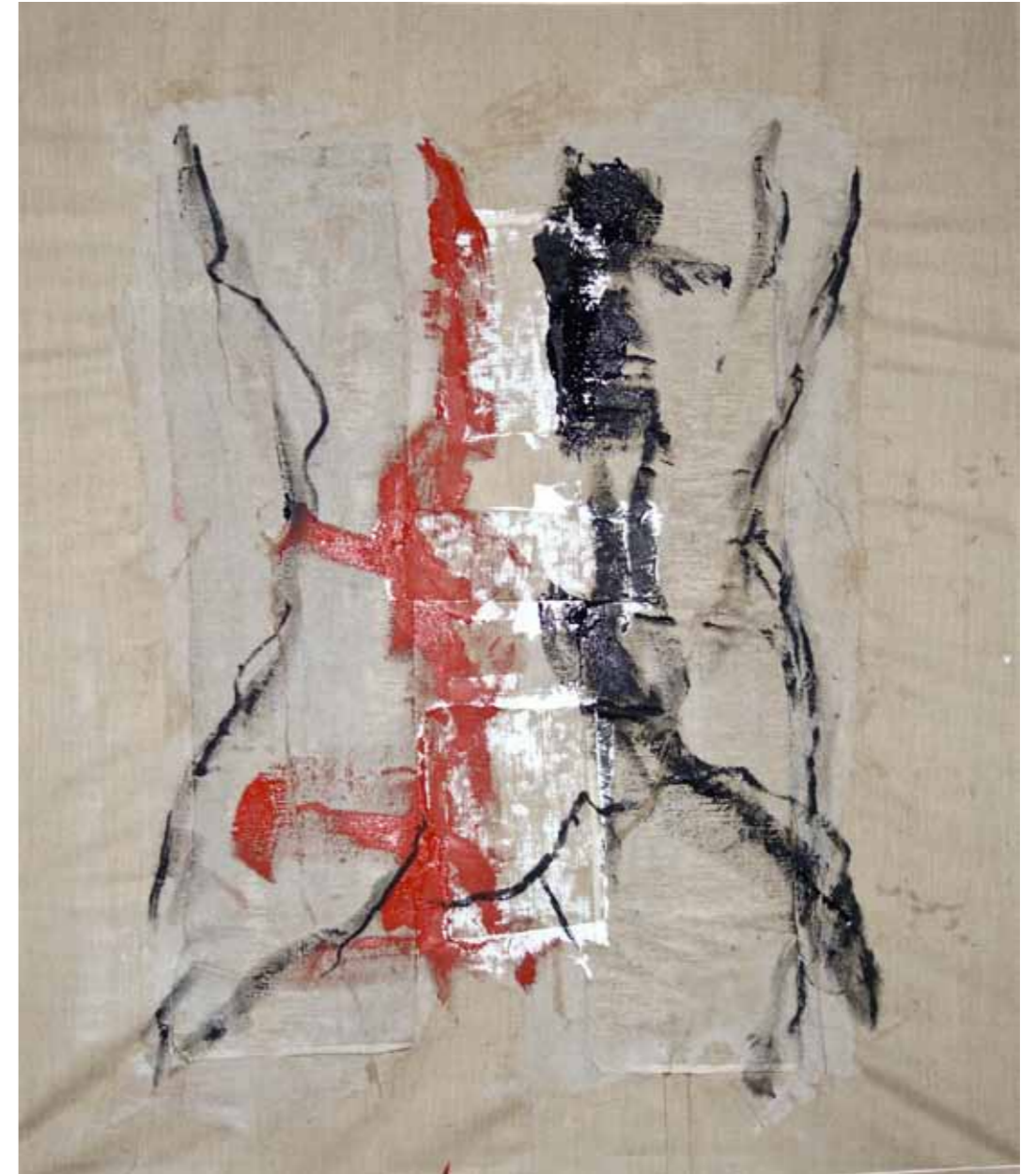
o. T., Acryl, Sand und Kohle auf Leinwand, 145 × 125 cm