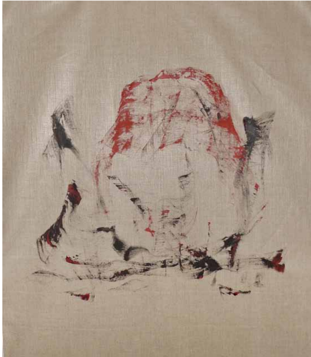
o. T., 2015, Acryl auf Leinwand, 145 × 125 cm