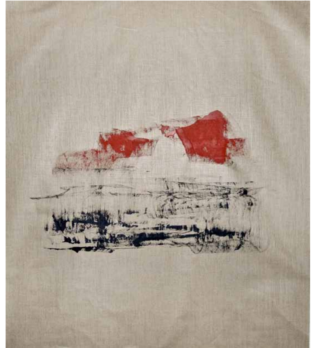
o. T., 2015, Acryl auf Leinwand, 145 × 125 cm