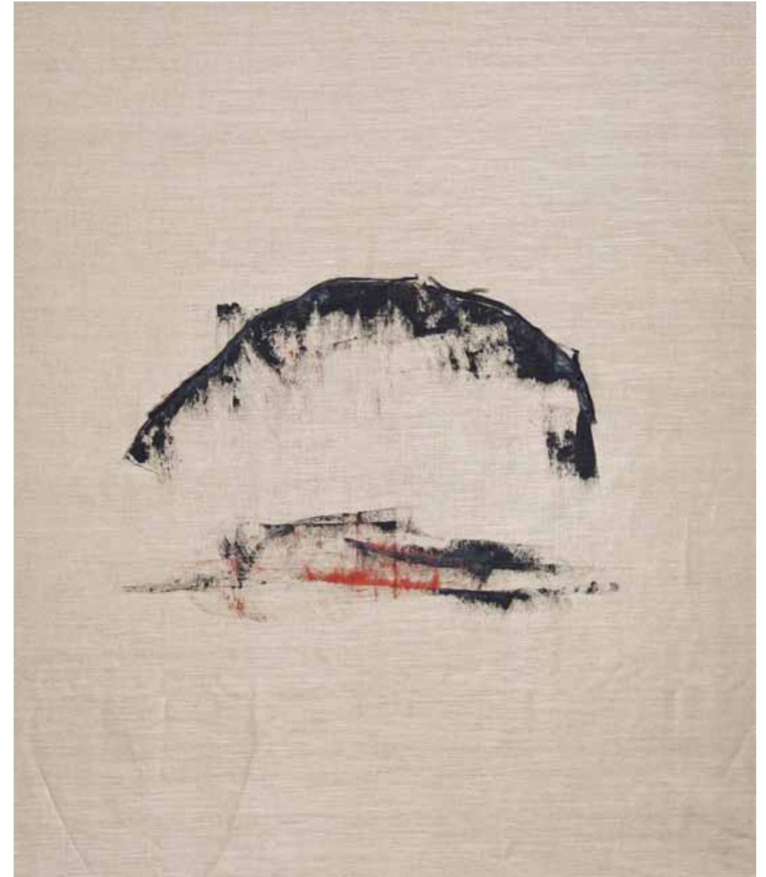
o. T., 2015, Acryl und Kohle auf Leinwand, 145 × 125 cm