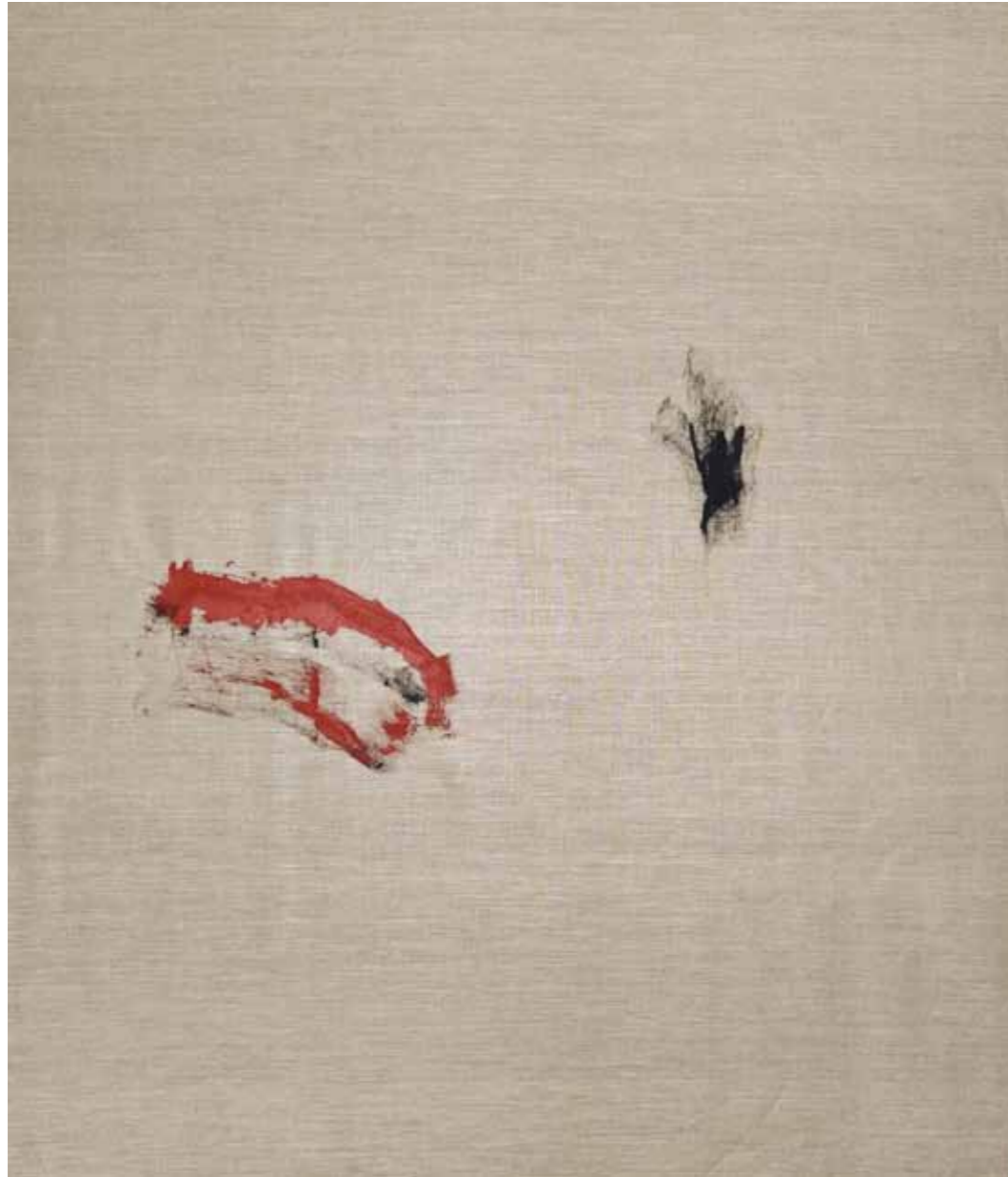
o. T., 2015, Acryl auf Leinwand, 145 × 125 cm