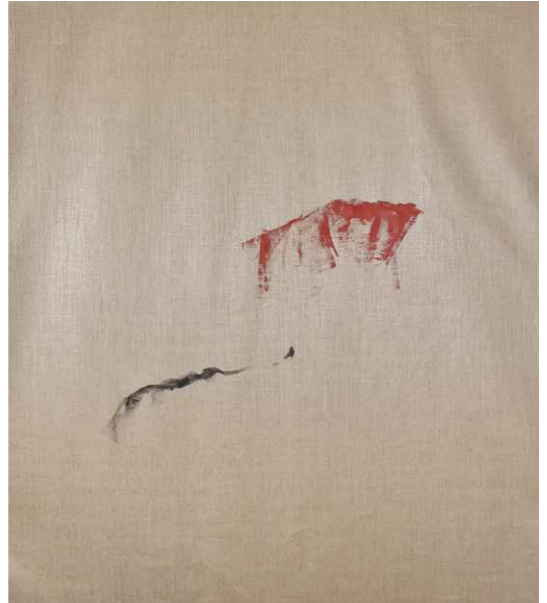
o. T., 2015, Acryl auf Leinwand, 145 × 125 cm