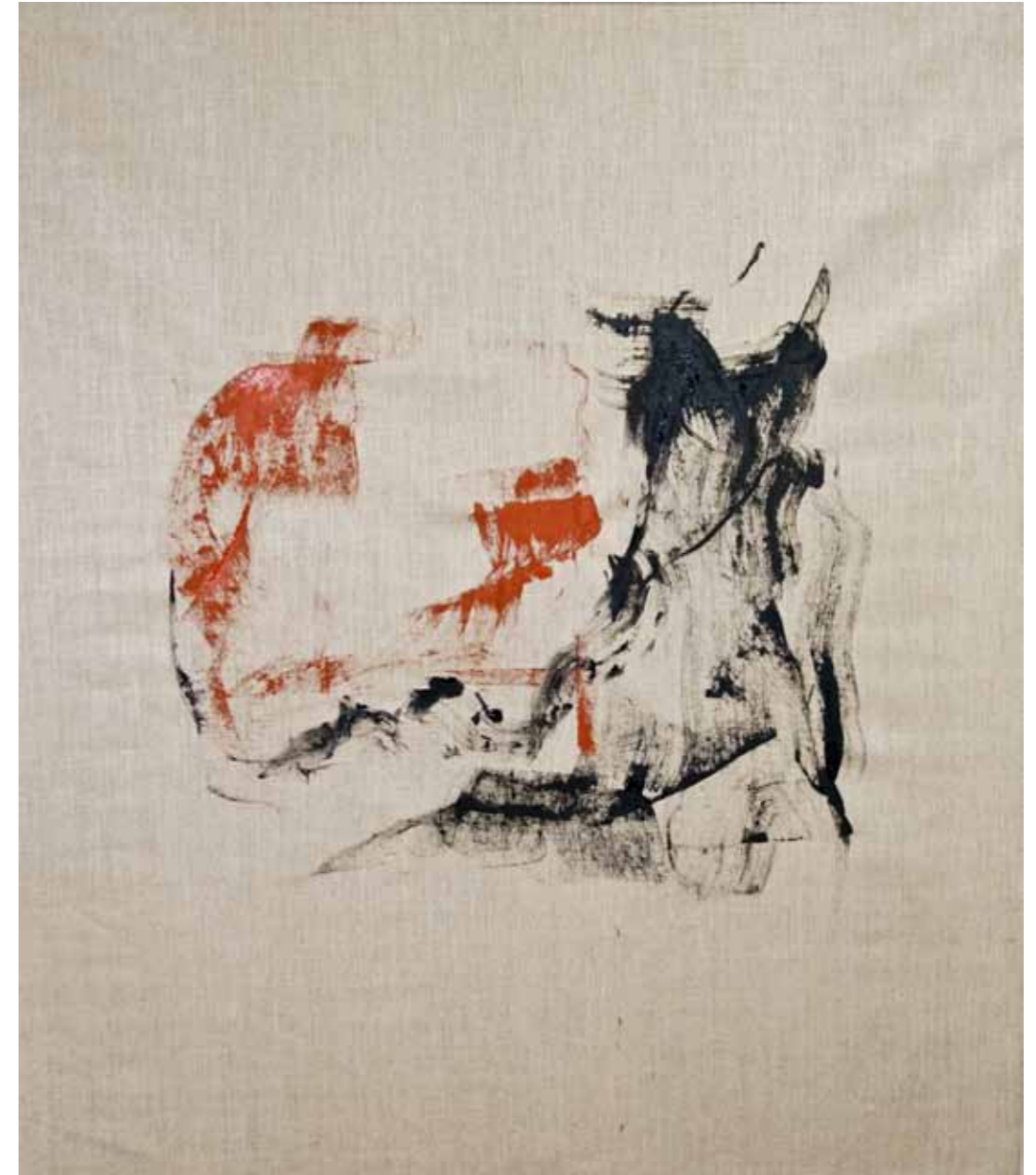
o. T., 2015, Acryl auf Leinwand, 145 × 125 cm