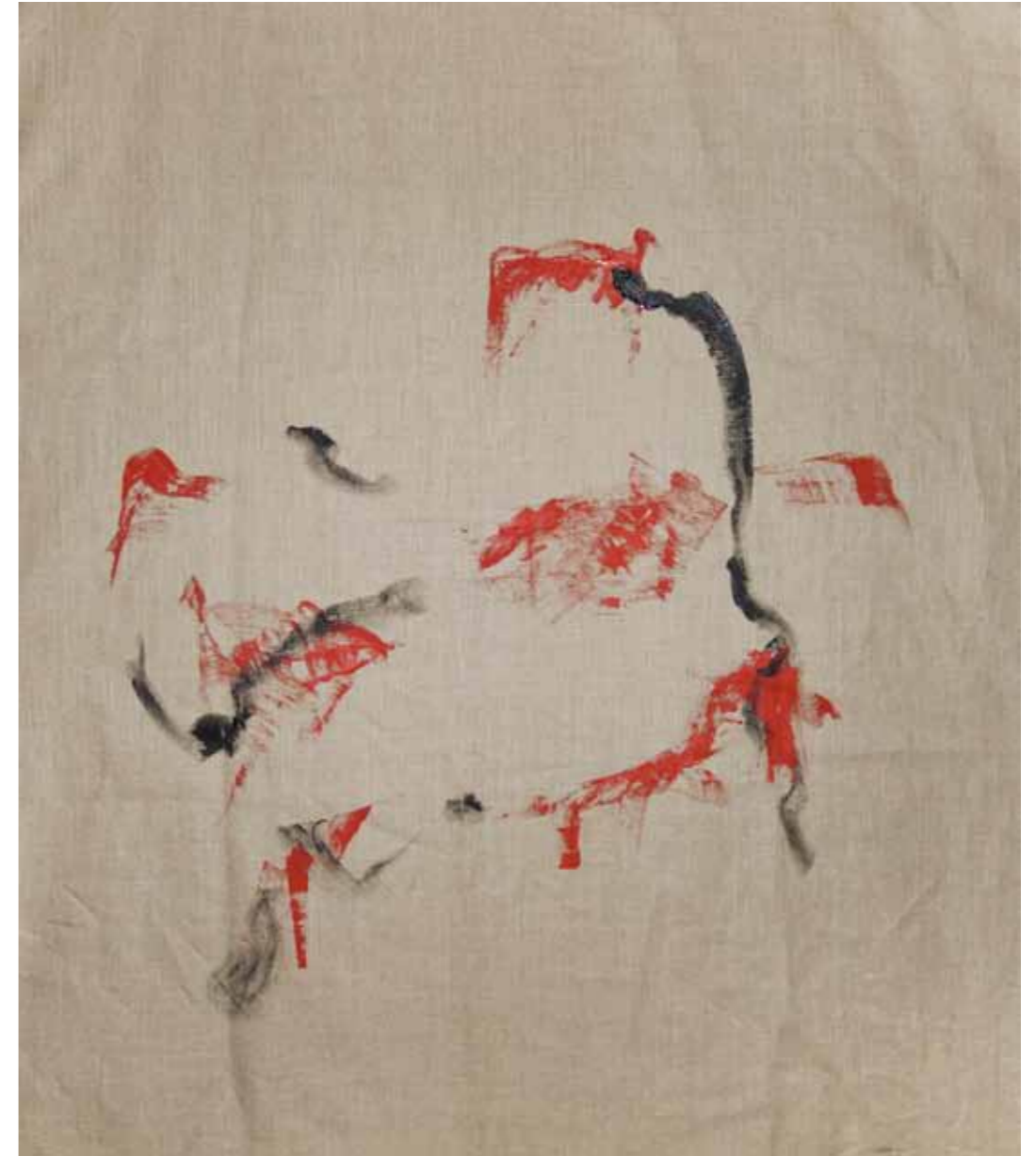
o. T., 2015, Acryl auf Leinwand, 145 × 125 cm