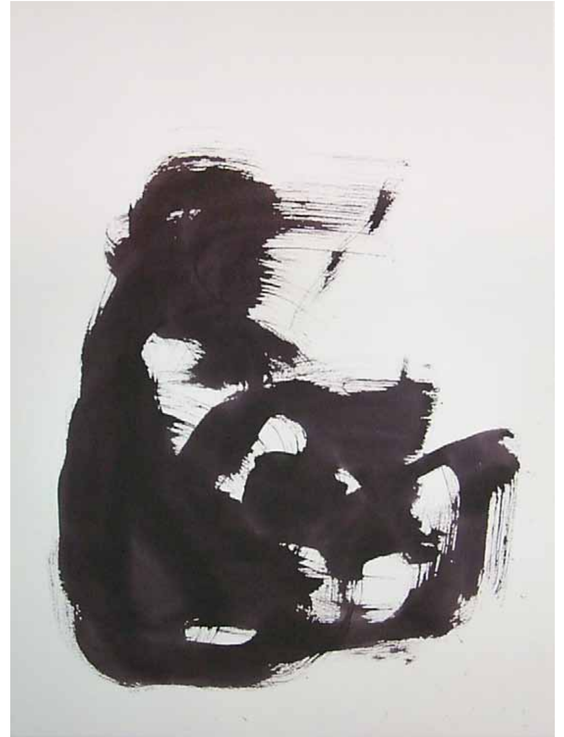
O. T., 1997; Acryl auf Aquarellpapier, 76 × 56 cm