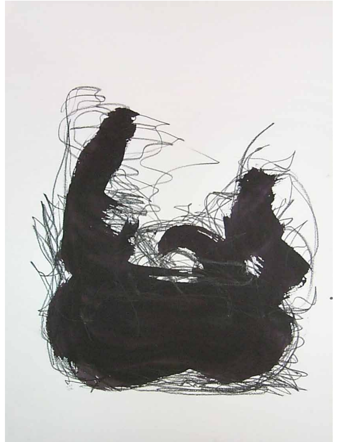
O. T., 1997; Acryl und Kohle auf Aquarellpapier, 76 × 56 cm