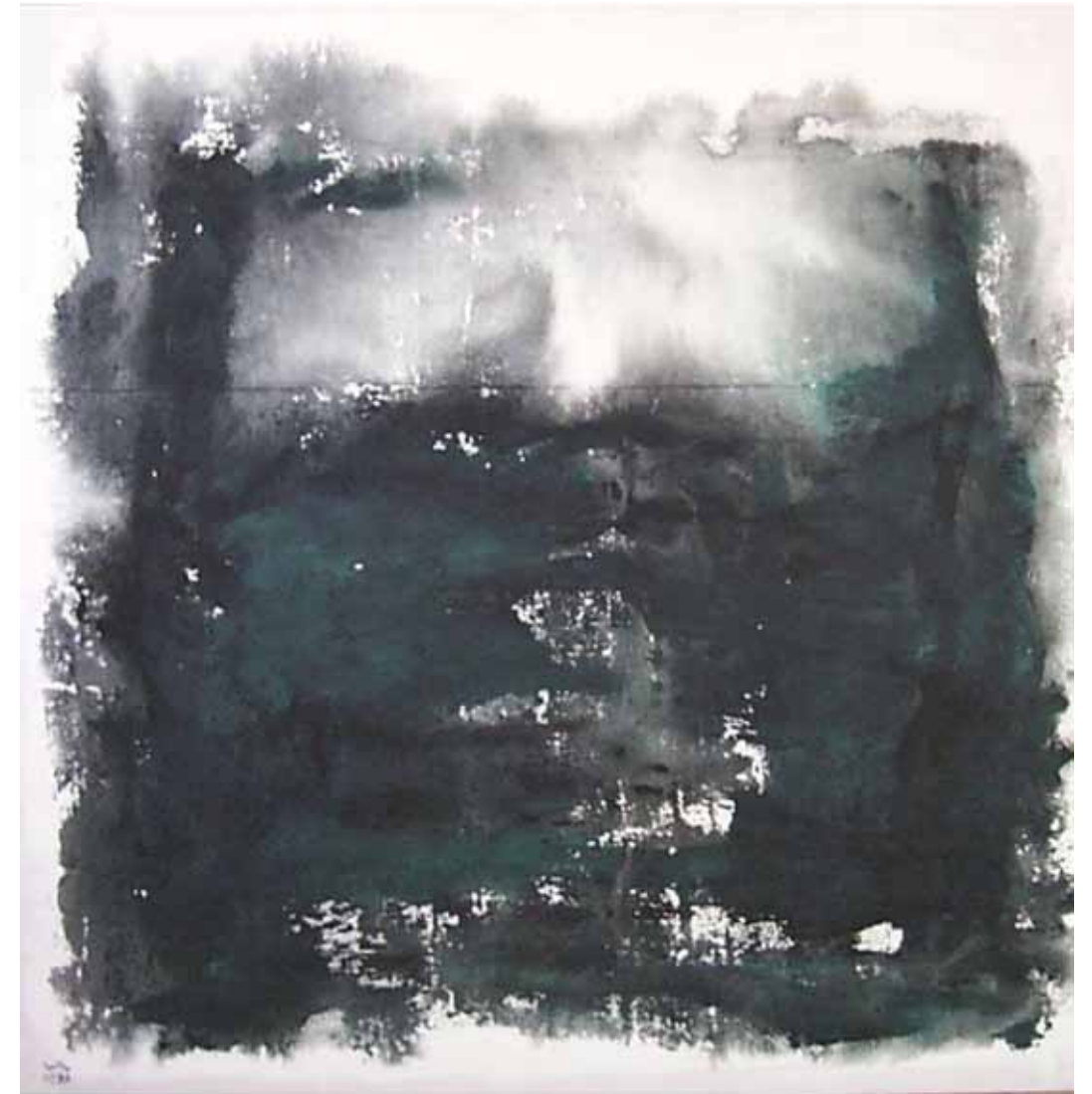
O. T., 1997; Acryl auf Segeltuch, 120 × 120 cm