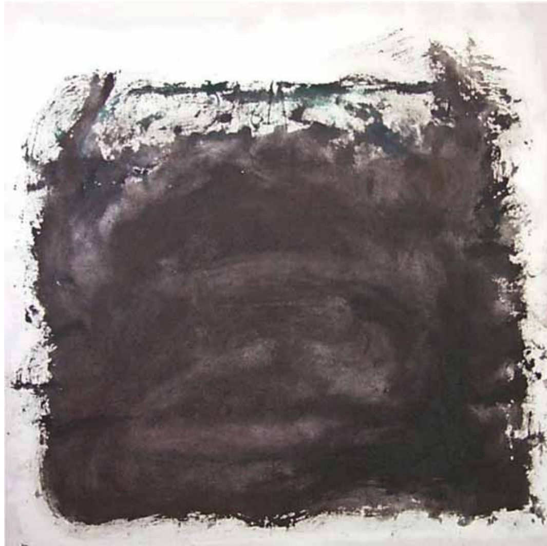
O. T., 1997; Acryl auf Segeltuch, 120 × 120 cm