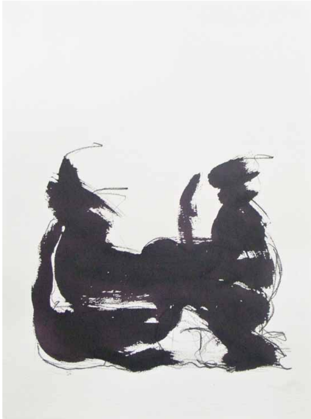
O. T., 1997; Acryl und Kohle auf Aquarellpapier, 76 × 56 cm