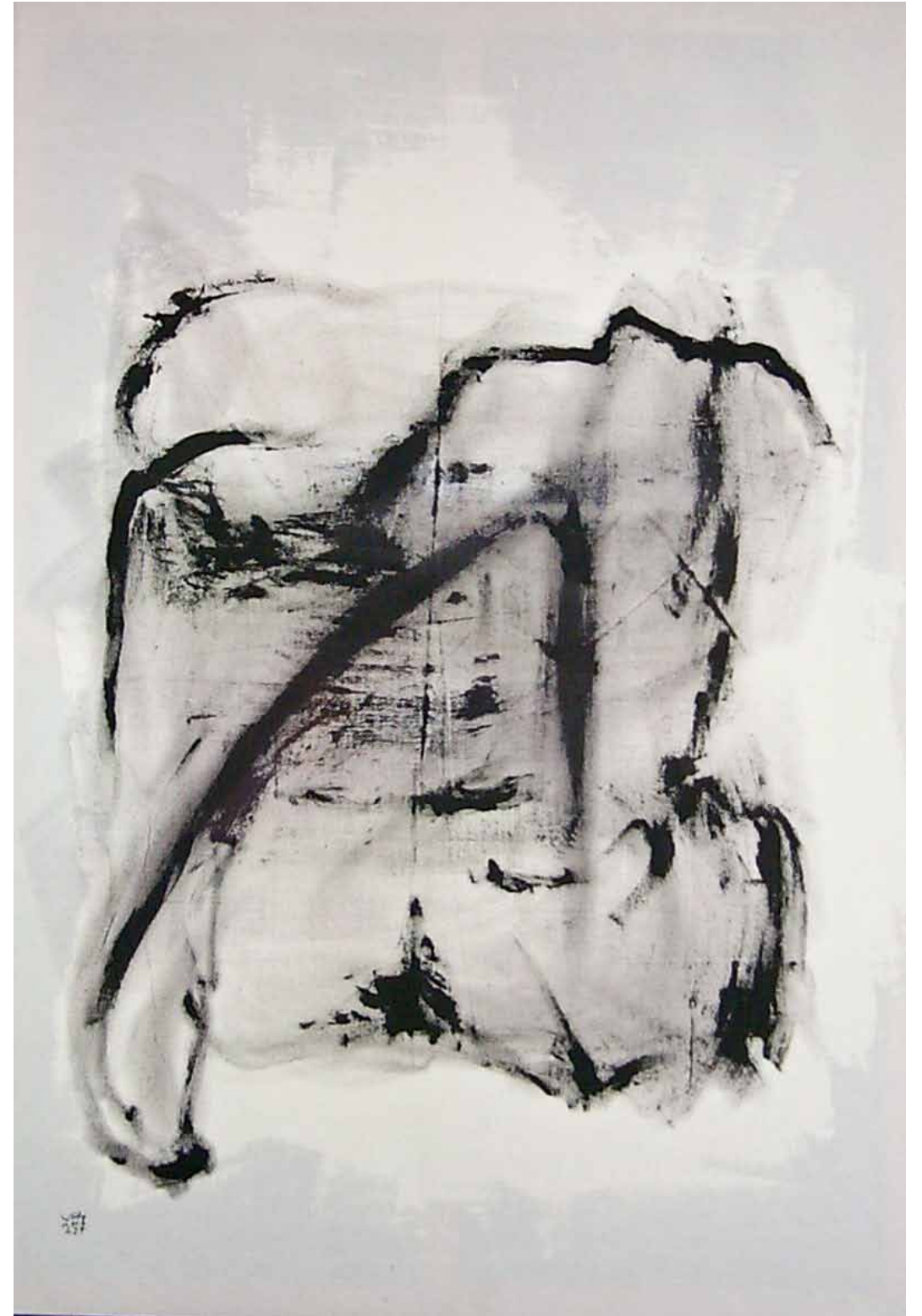
O. T., 1997; Acryl auf Segeltuch, 170 × 120 cm