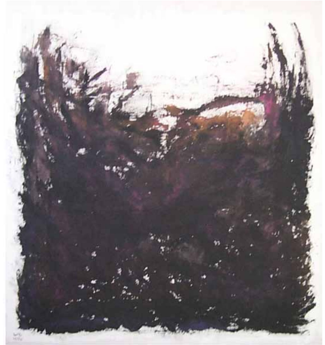
O. T., 1997; Acryl auf Segeltuch, 120 × 120 cm