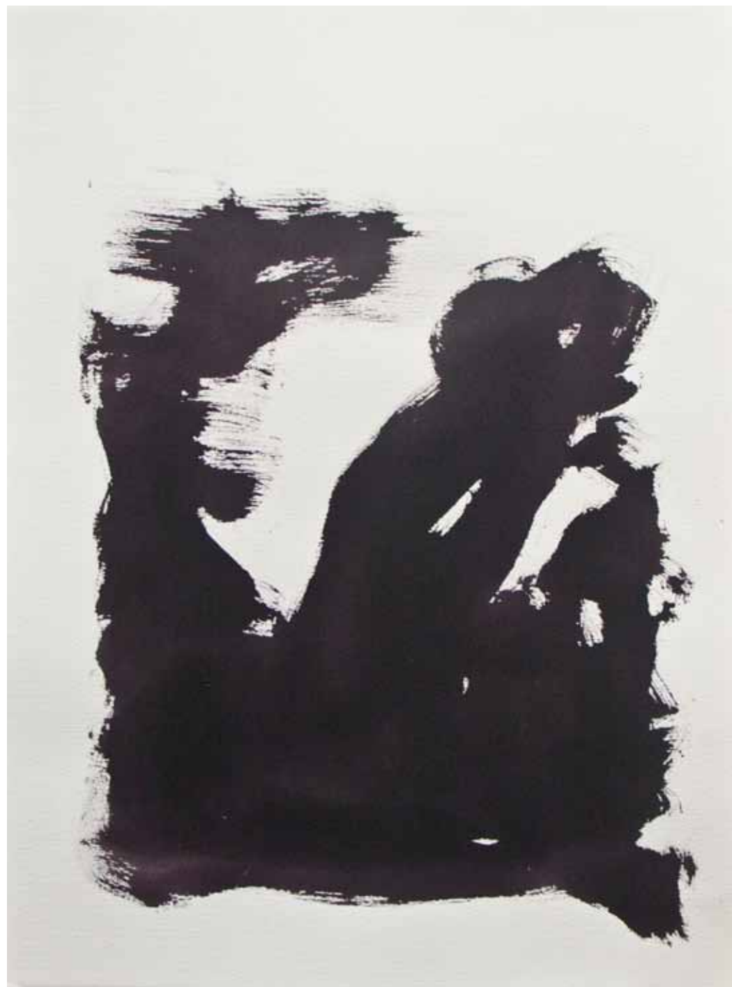
O. T., 1997; Acryl auf Aquarellpapier, 76 × 56 cm