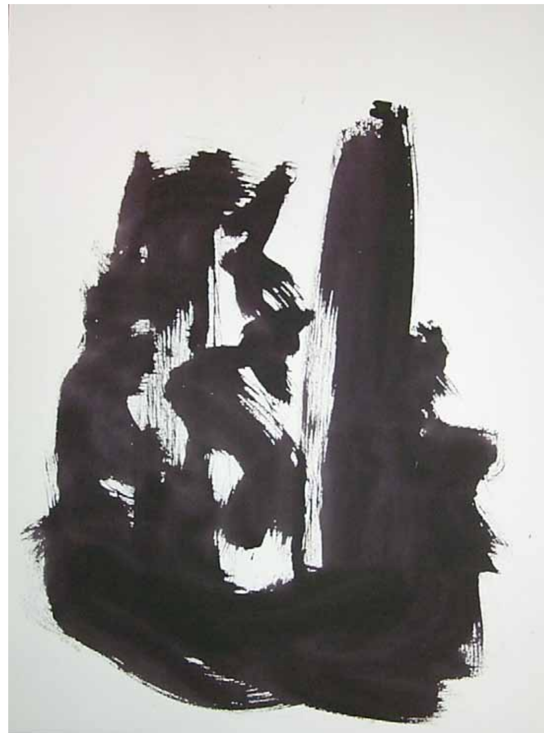
O. T., 1997; Acryl auf Aquarellpapier, 76 × 56 cm