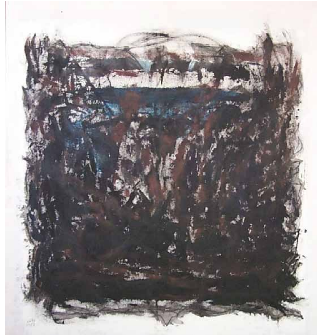
O. T., 1997; Acryl auf Segeltuch, 120 × 120 cm