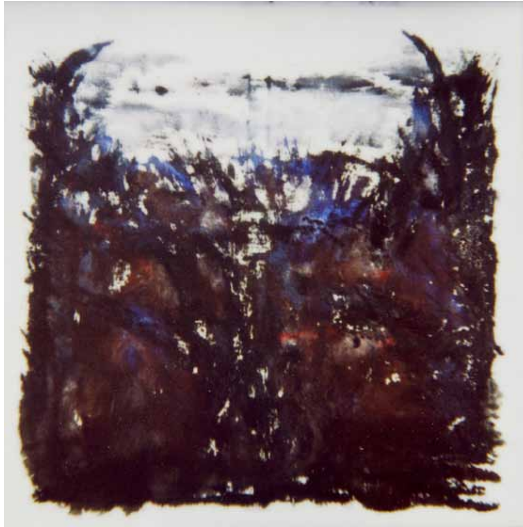
O. T., 1997; Acryl auf Segeltuch, 120 × 120 cm