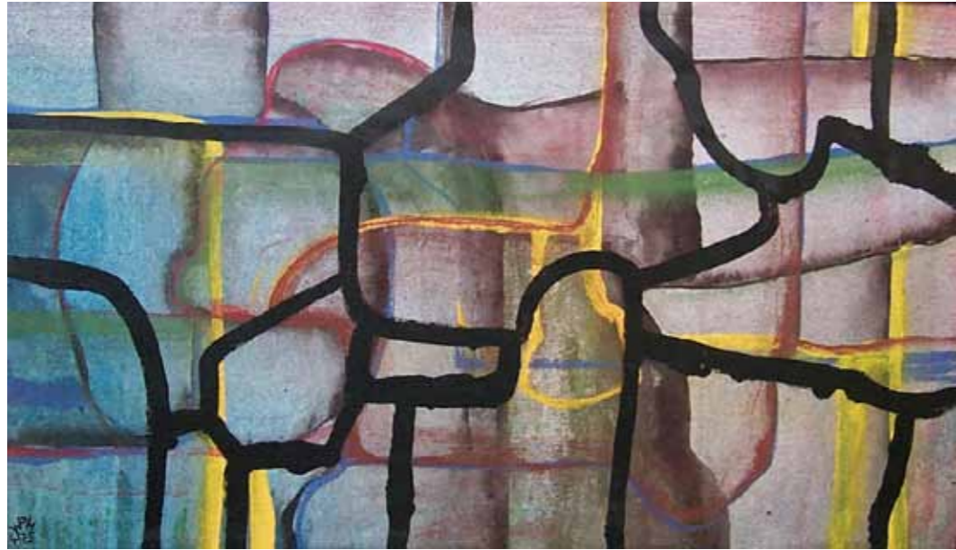
O. T., 1975; Acryl auf Holz, 40 × 70 cm