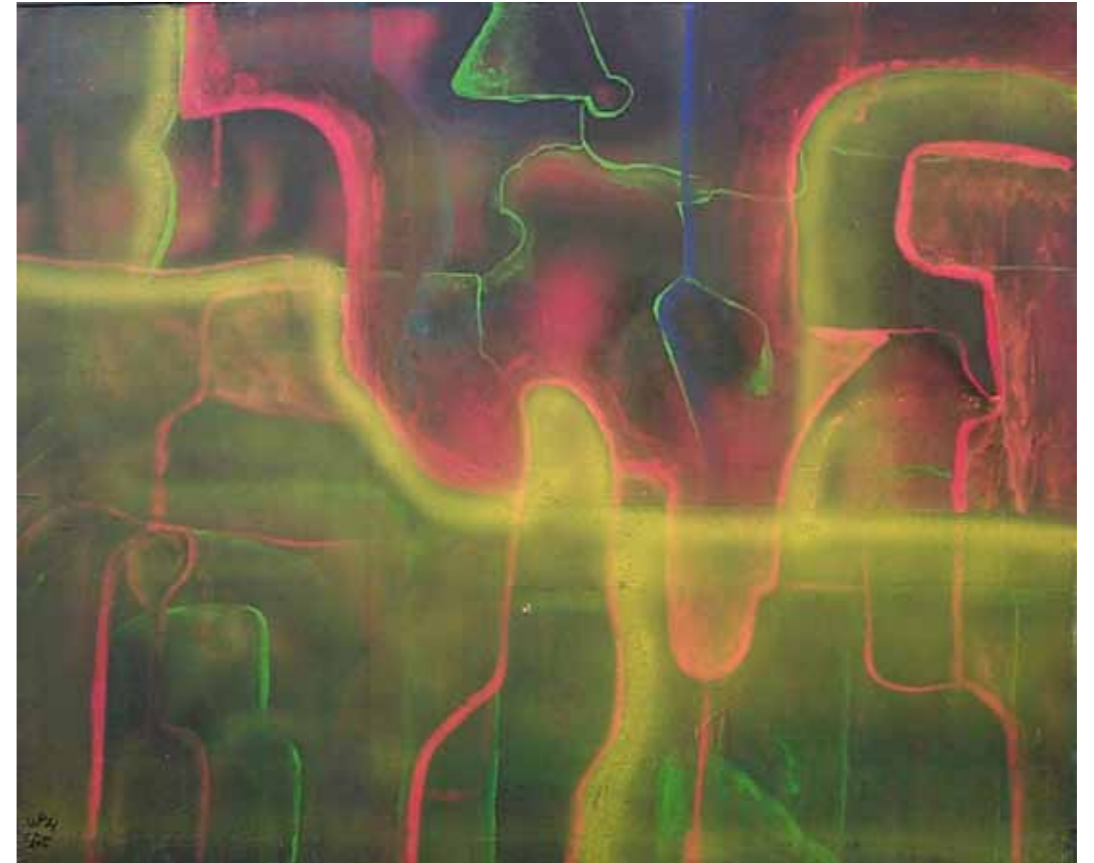
O. T., 1975; Acryl auf Holz, 30 × 40 cm