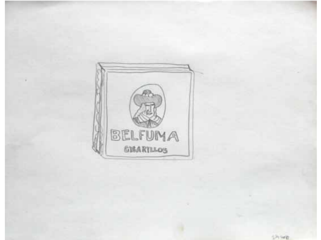
O. T., 1975; Bleistift auf Zeichenpapier, 24 × 31,2 cm