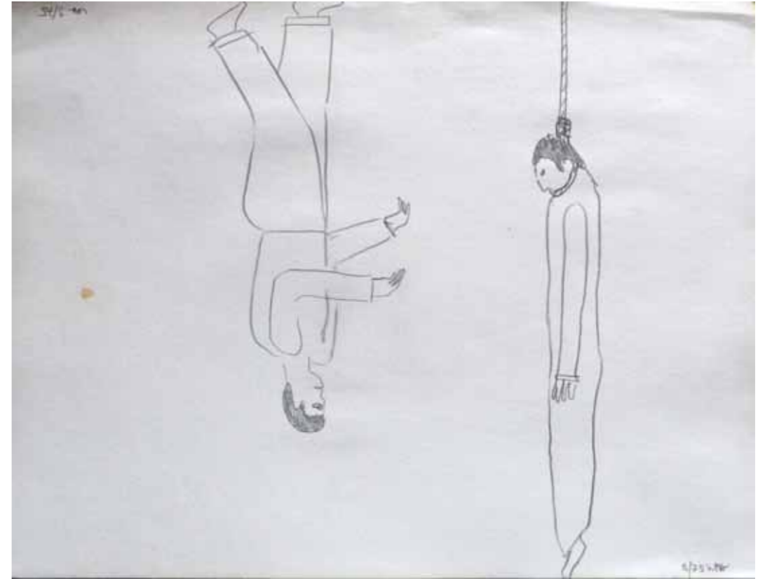
O. T., 1975; Bleistift auf Zeichenpapier, 24 × 31,2 cm