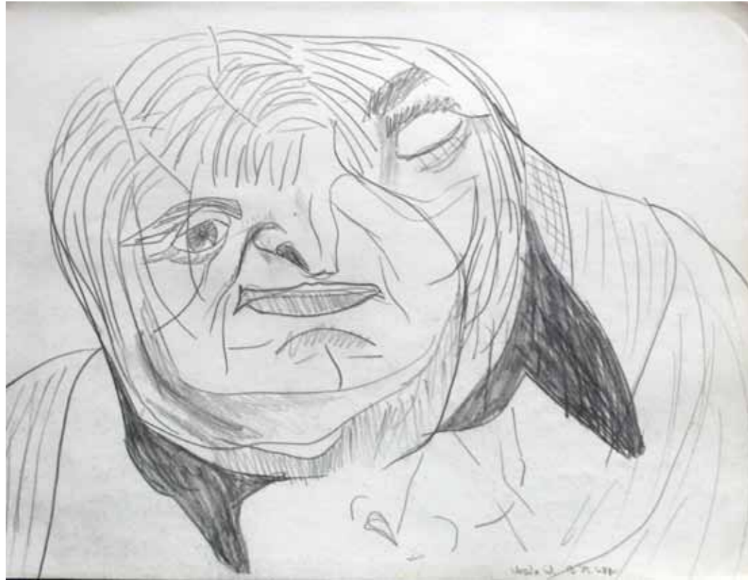
O. T., 1975; Bleistift auf Zeichenpapier, 24 × 31,2 cm