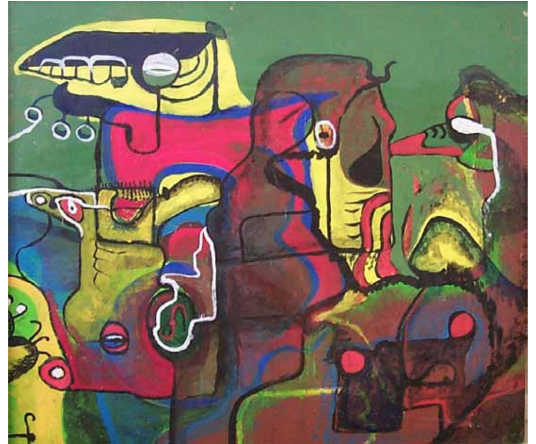
O. T., 1975; Acryl auf Holz, 70 × 81 cm